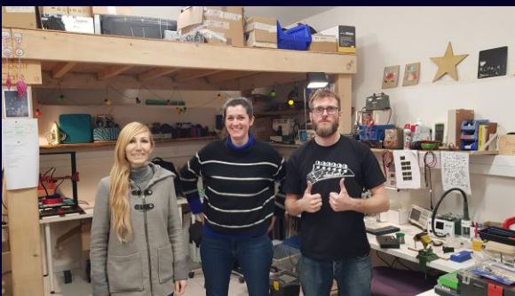
Session d'accompagnement à La Bricothèque, manufacture de Pernes-les- Fontaines

Pour un premier échange sur vos besoins : mathilde.berchon@futurfab.fr